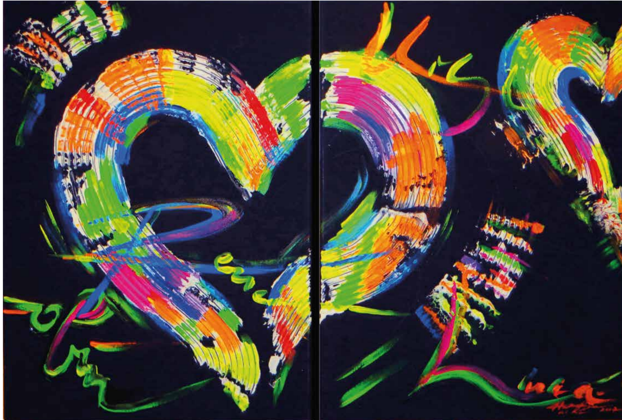
»Das Feingefühl deines Herzens« Acryl auf Leinwand gesamt 2 x 50 x 70 cm | Petra A. Hartmann

»Wir wünschen von ganzem Herzen ein gesegnetes Weihnachtsfest und ein glückliches Neues Jahr 2020«