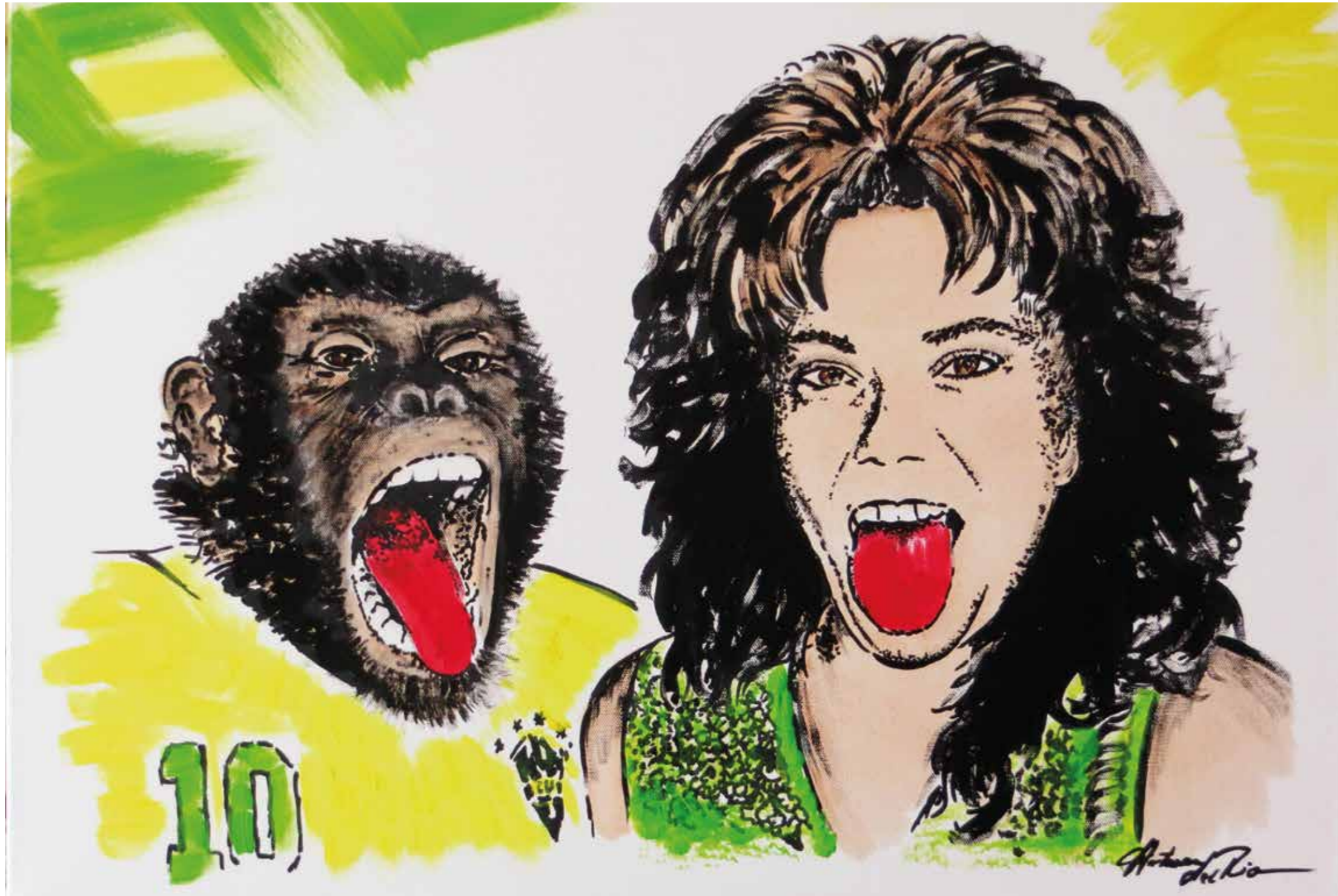
»Wahre Begegnung« Acryl auf Leinwand | 70 x 50 cm Petra A. Hartmann

Beste Freunde wissen wie verrückt du bist, trauen sich trotzdem noch mit dir in die Öffentlichkeit.