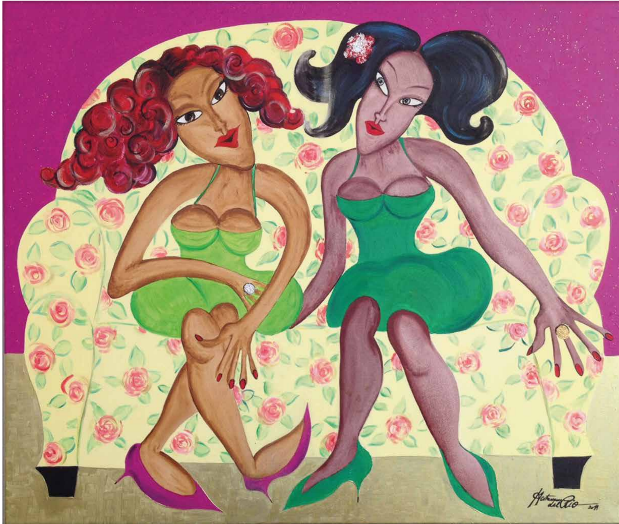
»Dos mujeres en el sofá« Öl auf Leinwand | 150 x 120 cm | 2013