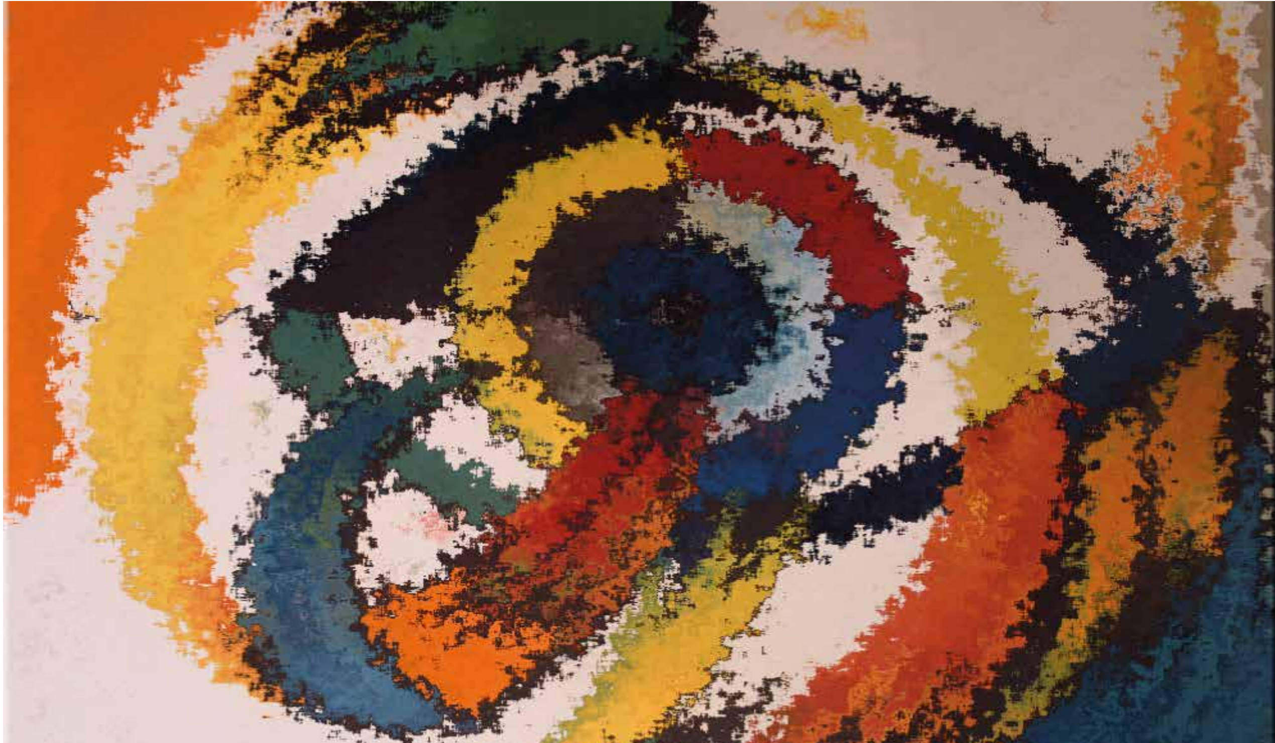
»Swirling eye« Acryl auf Leinwand | 70 x 50 cm | 2013 Petra A. Hartmann