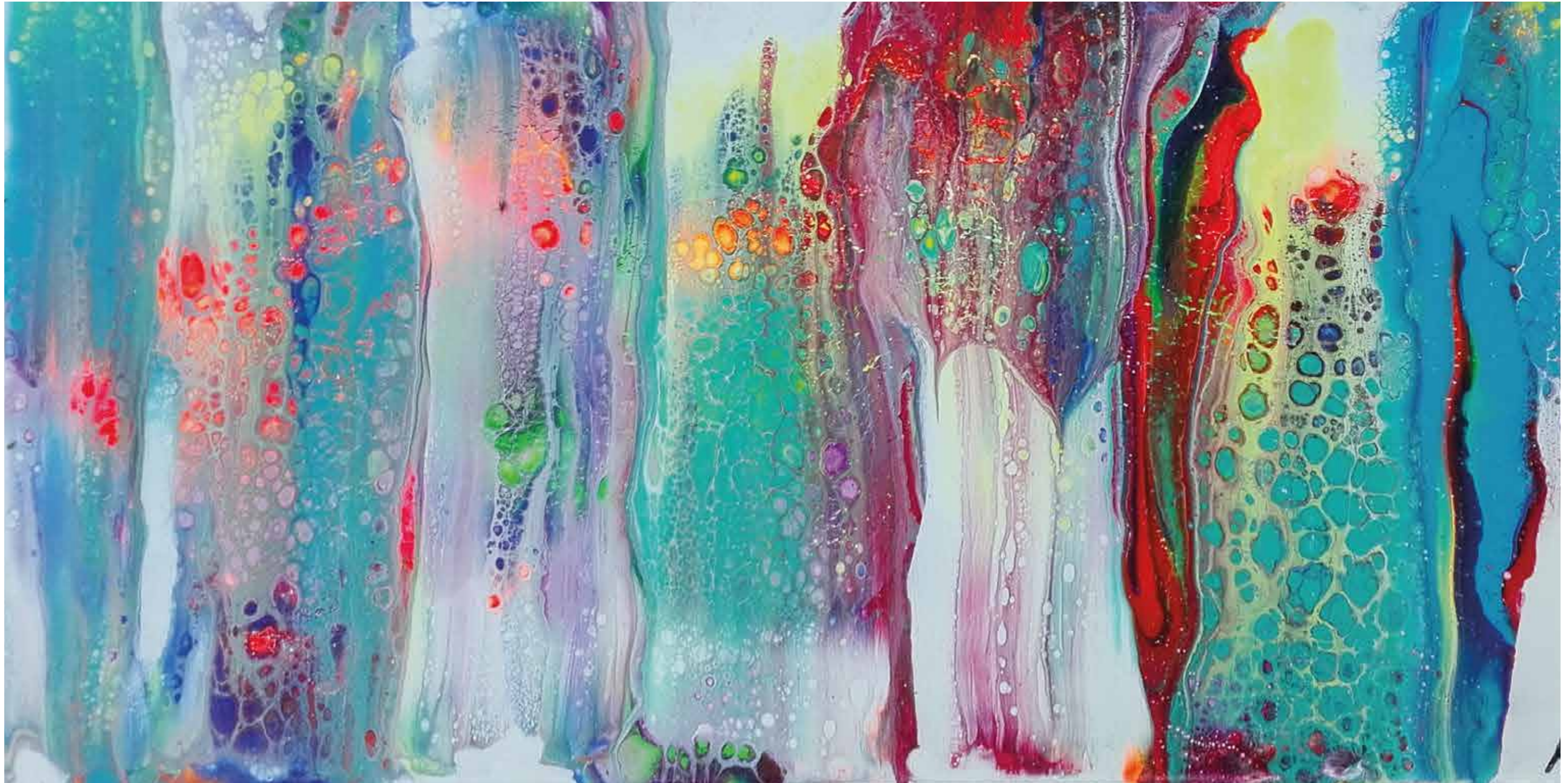
»Wasserfall trifft Regenbogen« Abstrakte Flüssigkeit Acryl-Malerei 2018 Petra A. Hartmann

»Die Hoffnung ist der Regenbogen über dem herabstürzenden Bach des Lebens« Friedrich Nietzsche