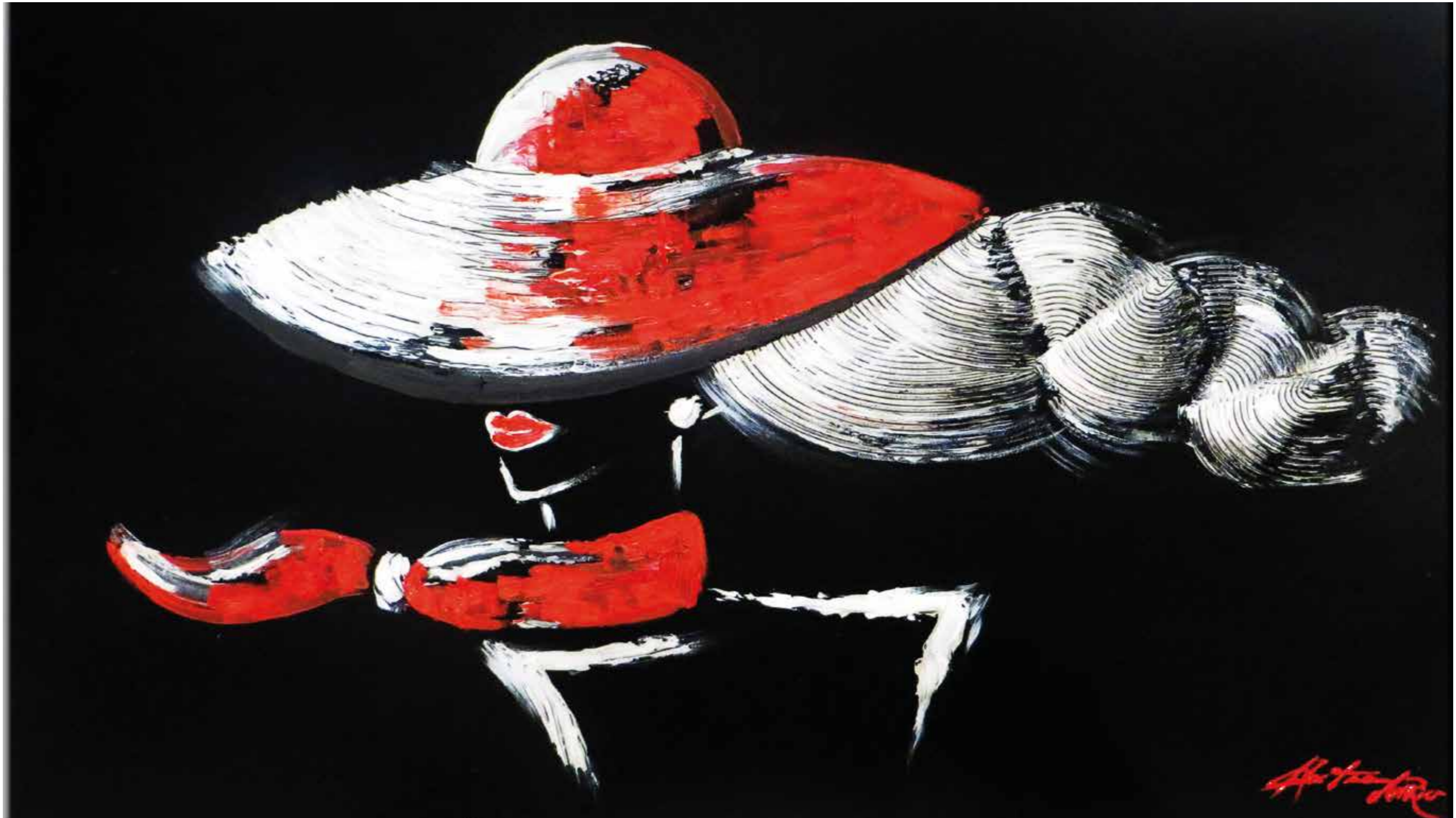
»Brombacher-Styl-Sólo para mujeres con estilo« Öl auf Leinwand | 100 x 70 cm | 2016 Petra A. Hartmann