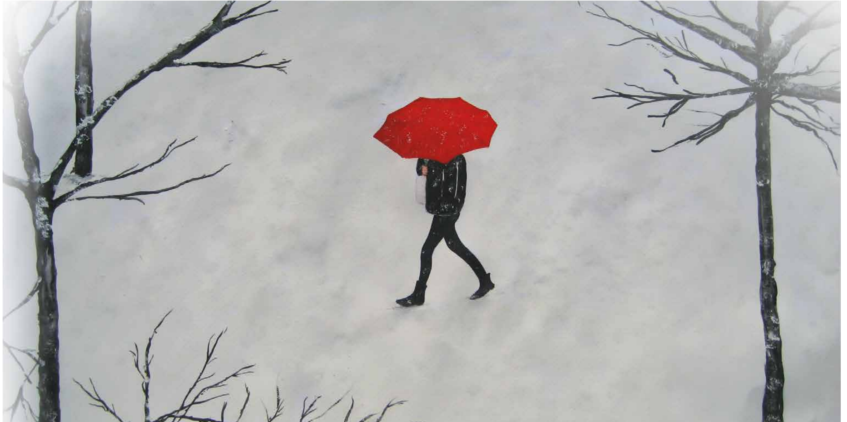
»Frau mit rotem Schirm in Lörrach« Aquarell - im Schnee | 70 x 50 cm | 2014 Petra A. Hartmann