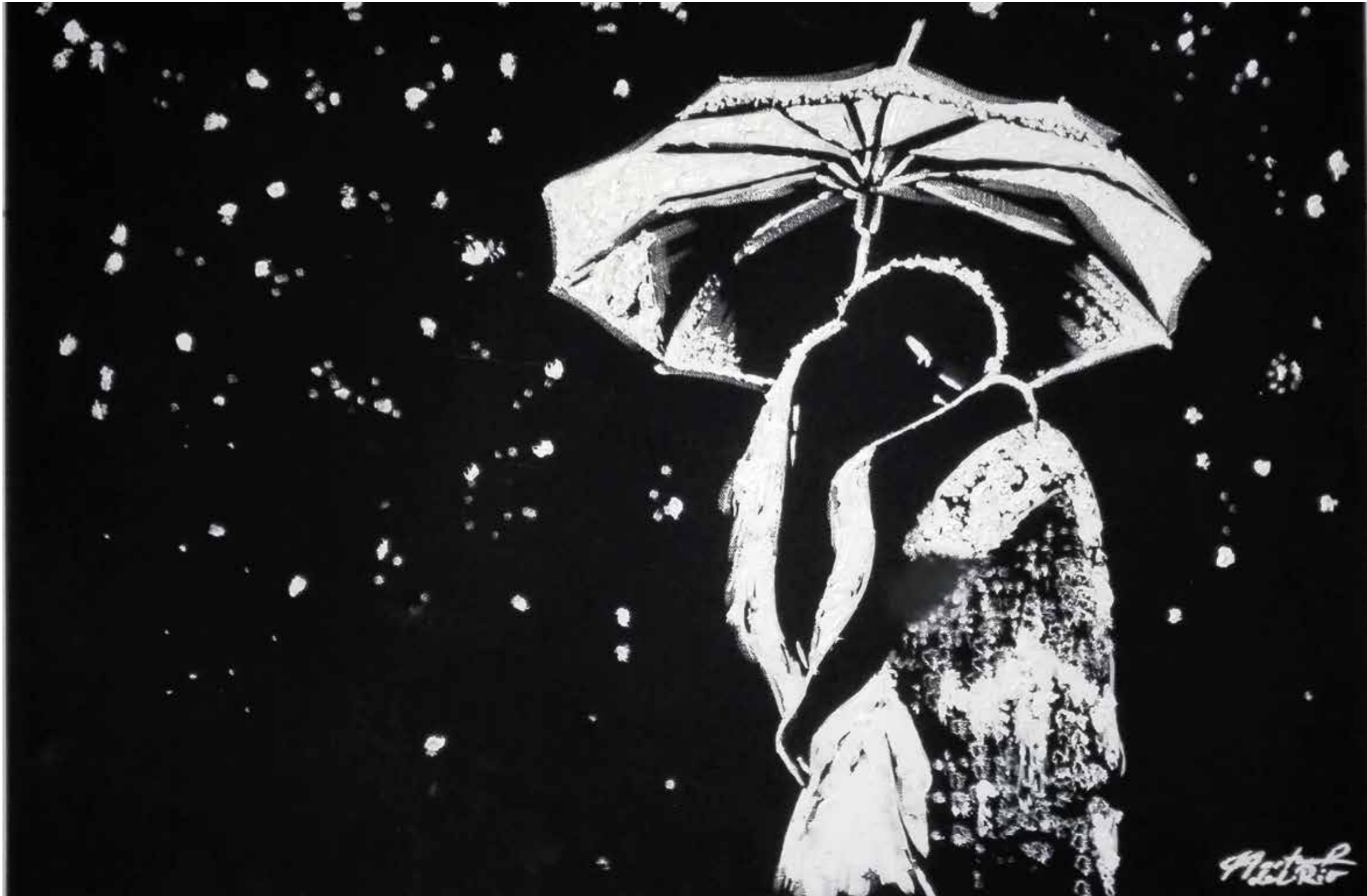
»Umarmung« Öl auf schwarzer Leinwand nur mit Titanweiß 70 x 50 cm | Petra A. Hartmann

Ich mag ... Träume, die gelebt werden ... Umarmungen, die von Herzen kommen ... meine Freunde ... Cappuccino am Morgen ... Frühstück im Bett ... Erinnerungen, die mich zum Lächeln bringen ... Angelächelt werden, ohne selber gelächelt zu haben ... Lachen bis mir die Tränen kommen ... spüren, dass ich lebe ... anonym