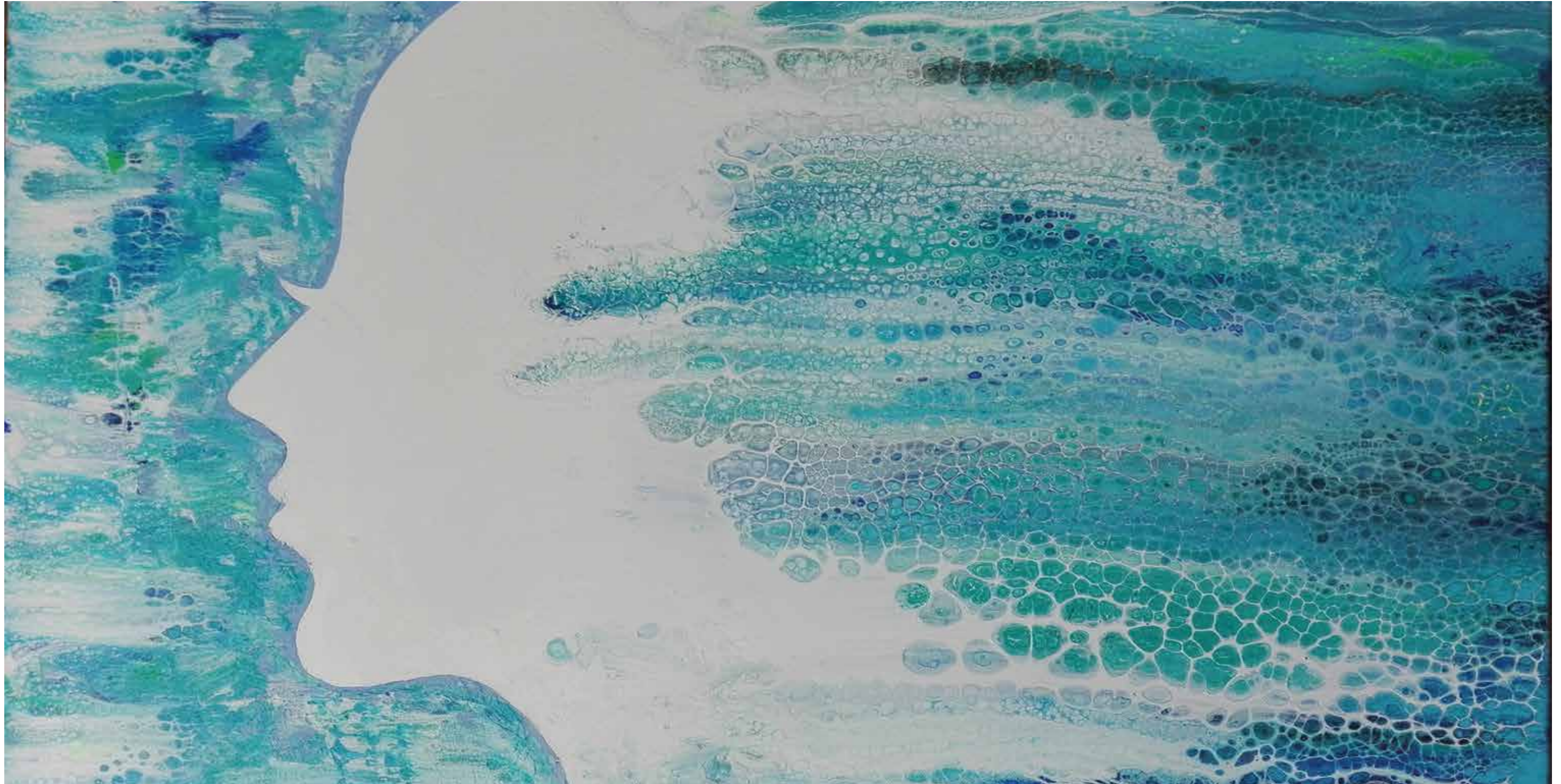
»Abtauchen– abtauchen ins Meer der Freiheit, abtauchen und schwerelos fühlen« Abstrakte Flüssigkeit Acryl-Malerei | 80 x 50 cm | 2018 Petra A. Hartmann