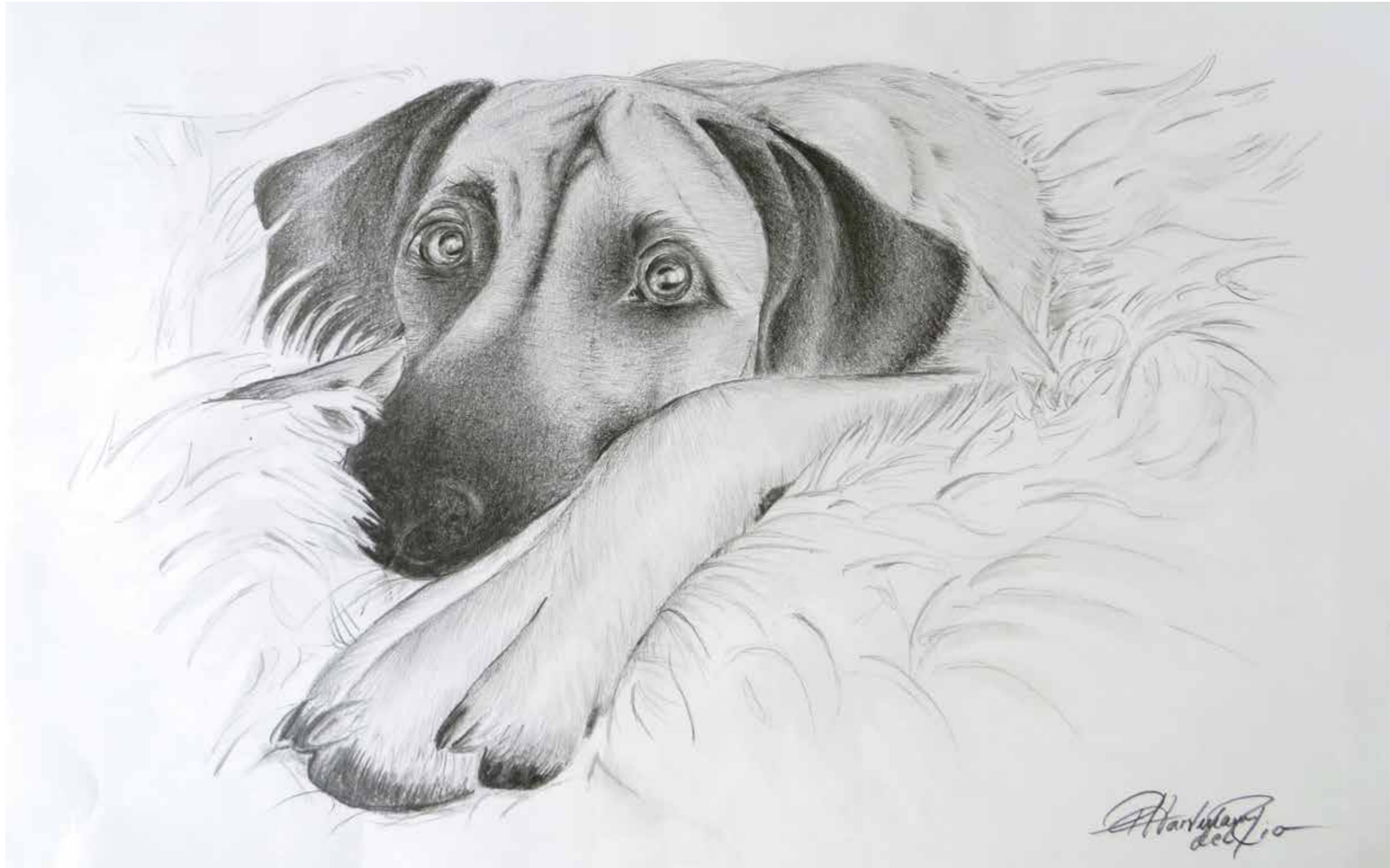
»Clara« Bleistift | 50 x 40 cm Petra A. Hartmann